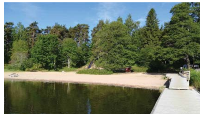
Badstrand / Uimaranta

Knipnäsin ent. piirimielisairaala on rakennettu vuosina 1927-1936. Rakennus oli tarkoitettu alun perin