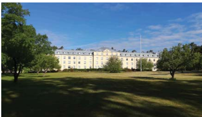
Huvudbyggnad / Päärakennus

Knipnäs f.d. kretsmentalsjukhus byggdes under åren 1927–1936. Byggnaden var ursprungligen