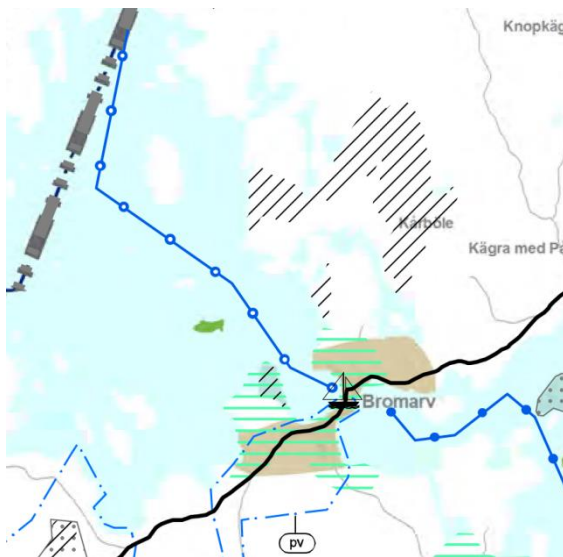
Utrag ur landskapsplanen.

I den mera detaljerade planeringen av området skall man beakta kultur- och naturlandskapets värden samt bevarandet av värdefulla naturförhållanden, förbättrandet av miljöns tillstånd och främjandet av vattenvården samt rekreations-behovnen. I samband med den mera detaljerade planeringen skall man utreda och beakta viktiga fågelområden.