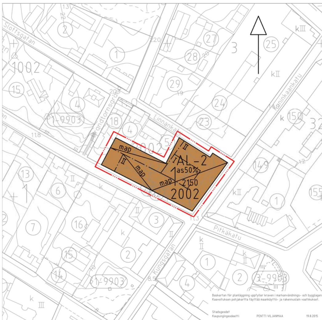
Bild: Gällande detaljplan

I den gällande detaljplanen är området kvartersområde för bostads-, affärs- och kontorsbyggnader (AL-2), i vilket våningsytan ämnad för bostäder skall placeras i byggnadens andra våning.