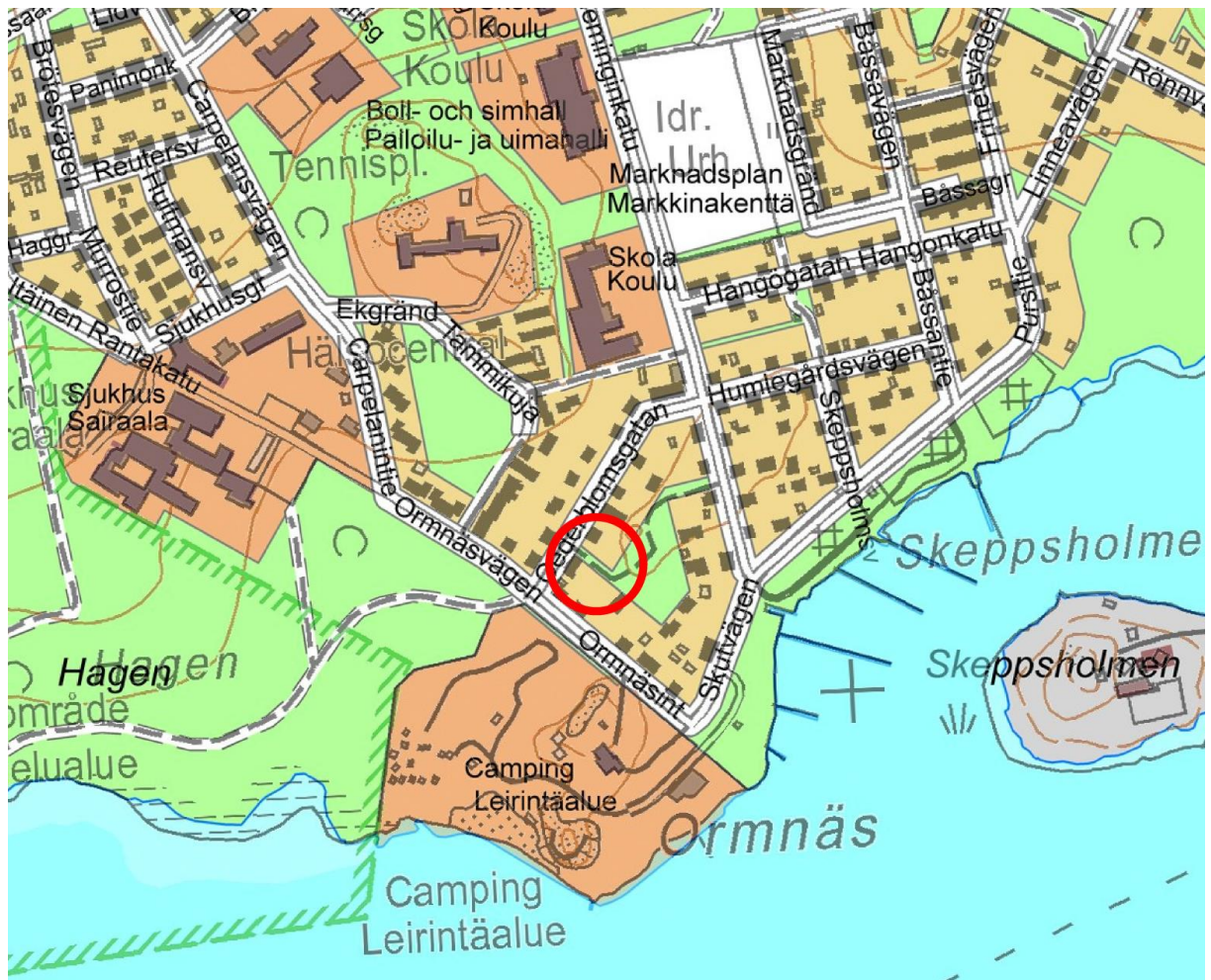
Bild 1. Planeringsområdets läge