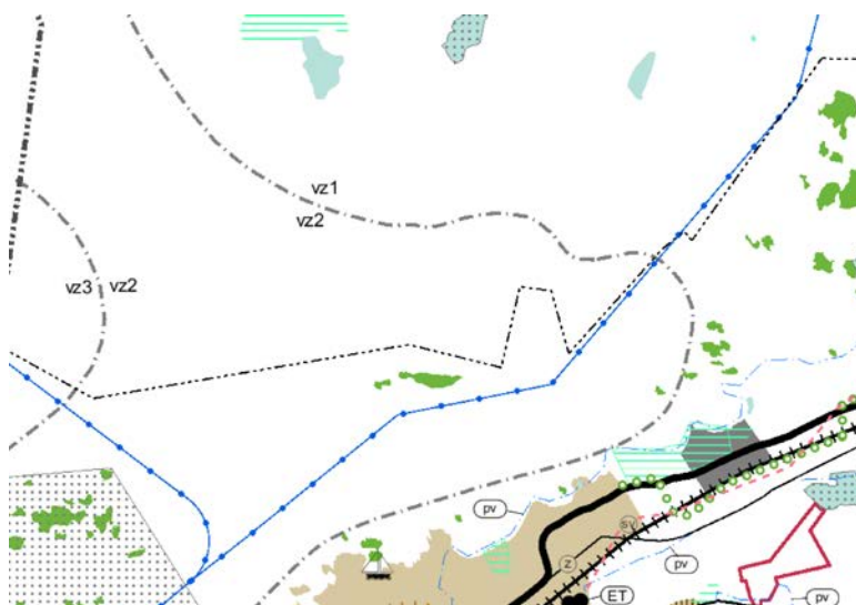
Ote maakuntakaavasta. Horsö on kuvan keskikohdassa kuntarajan yläpuolella.

Vyöhykettä on tarkoitus suunnitella ensisijaisesti saaristoelinkeinojen ja soveltuvien osin vapaa-ajan asumisen alueena, jossa uusi rakentaminen on pienimuotoista ja maiseman ominaispiirteet huomioon ottavaa.