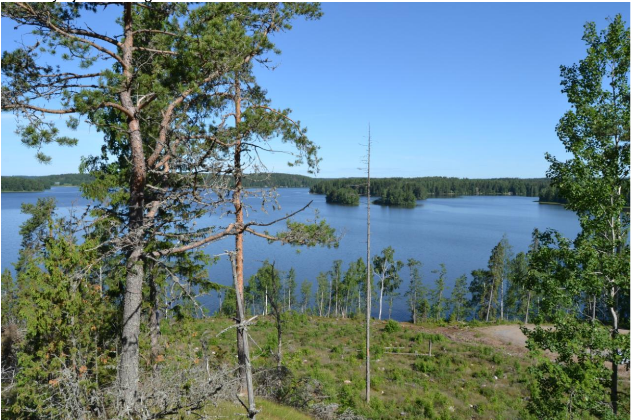
Näkymä Bråtanilta Lohjan järvelle luoteeseen

Bråtanilla sijaitseva osa suunnittelualueesta on metsää kasvava ja viettää pääasiassa luoteeseen. Västeruddenilla sijaitseva osa suunnittelualueesta on metsää kasvava ja melko jyrkkärinteinen joka viettää pohjoiseen, itään ja etelään. Luontoselvitys ja arkeologinen inventointi tehdään suunnittelualueella kesällä 2014.