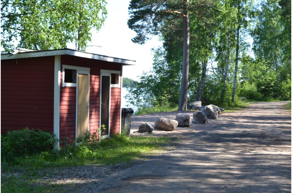
Pukeutumistila Bråtanin uimarannalla