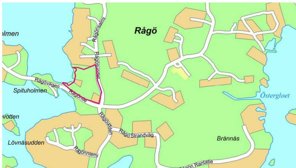
Suunnittelualue merkitty punaisella viivalla

Kaava-alue sijaitsee Tammisaaren saaristossa Rågön saaren länsirannalla. Alue käsittää Rågön kylässä olevan tilana RN:o 4:81 (710-443-4-81) sekä osan tilasta 4:137 (710-443-4-137). Kaava-alueen koko on noin 2,4 ha.