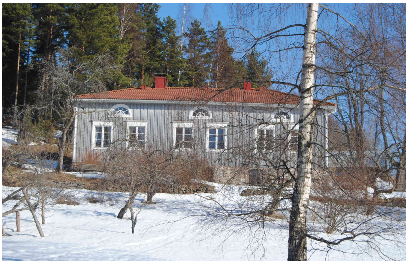
Bostadsbyggnaden i sin nuvarande form sedd från stranden.

Naturskyddsområdet i den gällande planen är bevuxet med blandskog med väsentliga inslag av ädla lövträd. Marktypen är lundaktig. Till övriga delar kan området karaktäriseras som sedvanlig ekonomiskog.