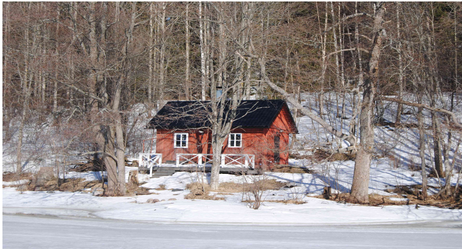
Bastun ligger ca 10 meter från stranden. Sidobostadens byggnadsyta ligger bakom trädbeståndet upp till höger på bilden.