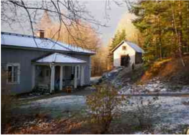
Sädesmagasinet bredvid karaktärshuset.