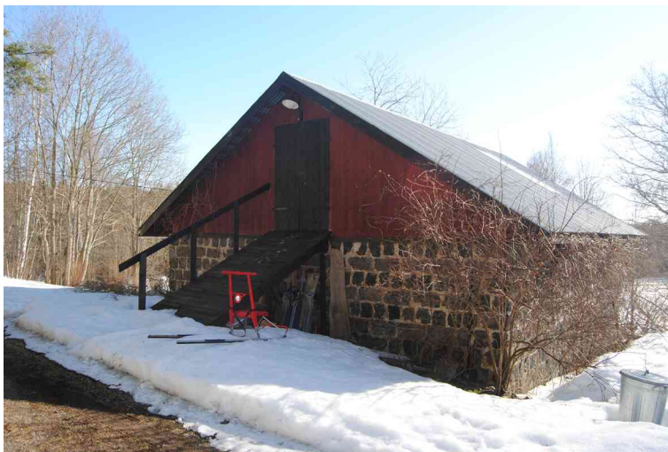
Ladugården utnyttjas som förvaringsutrymme.