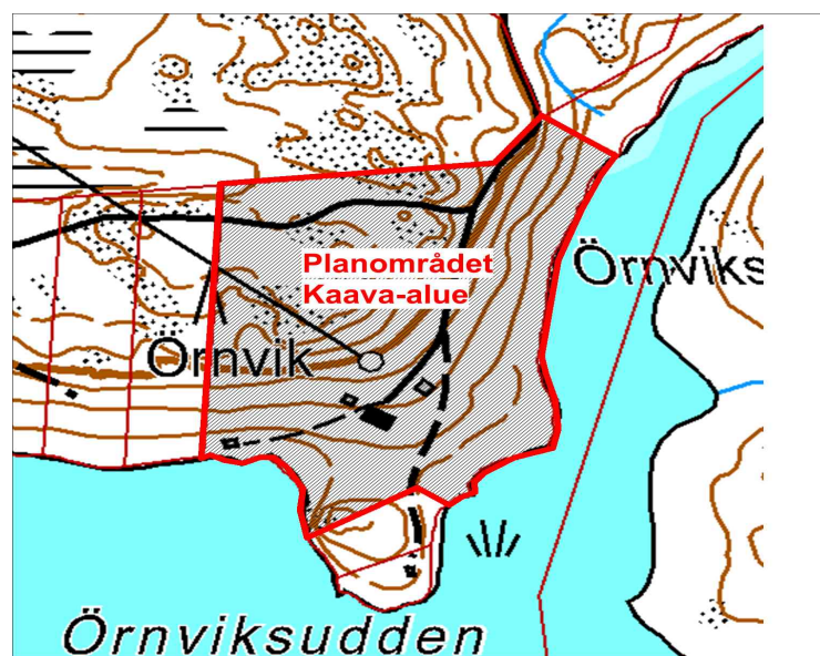
Örnviks läge och planområdet.