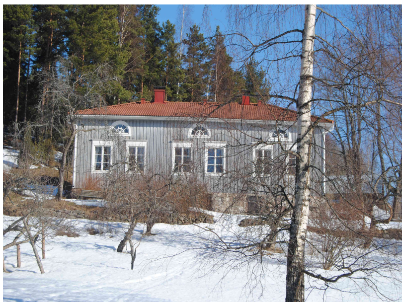
Asuinrakennus nykyisessä asussaan rannasta katsottuna.

Voimassa olevan kaavan luonnonsuojelualueella kasvaa sekametsää, jossa olennaisen osan muodostaa jalolehtipuusto. Kasvualusta on lehtotyyppiä. Muilta osin aluetta voidaan luonnehtia tavanomaisena talousmetsänä.