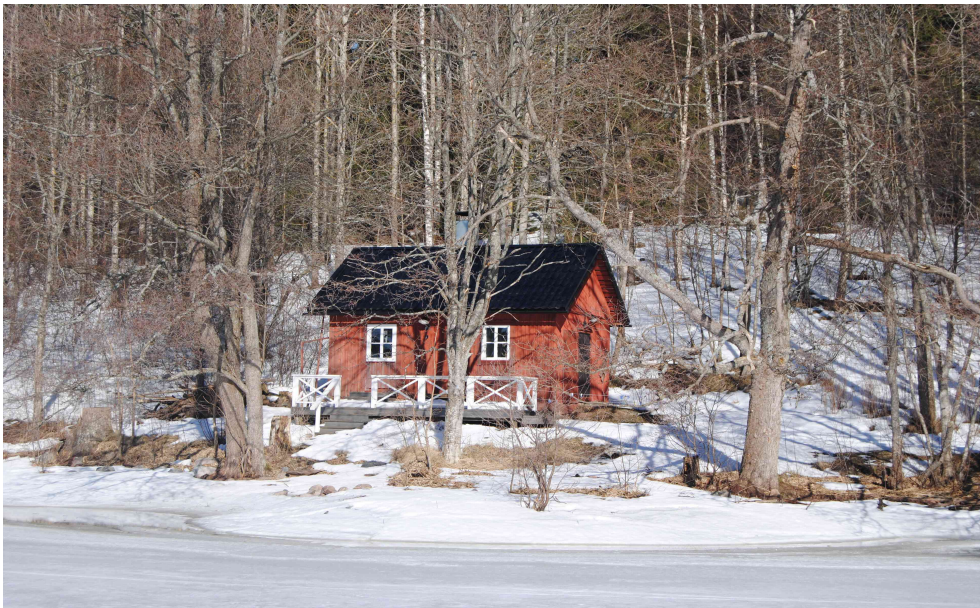
Sauna on n. 10 metrin etäisyydellä rannasta. Sivuasunnon rakennusala sijoittuu kuvan oikeaan yläreunaan metsikön taakse.