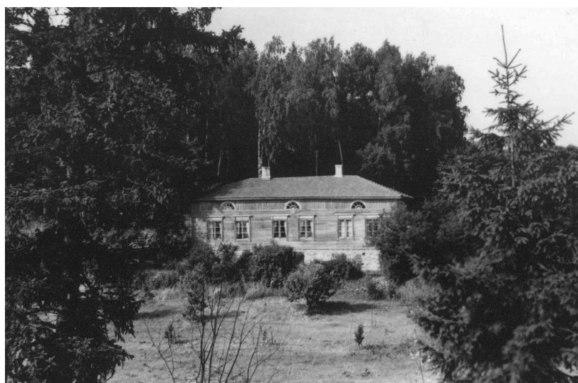
Asuinrakennus kuvattuna v. 1955.