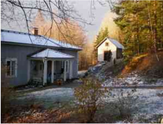
Viljamakasiini päärakennuksen vieressä.