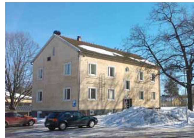
Asuntolakäytössä olleet 1940-luvun rakennukset muutetaan takaisin asunnoiksi.

Pysäköintipaikat tulee erottaa pihan oleskelualueista esimerkiksi istutuksin.