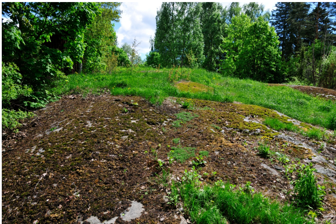
Gumnäs. . Backen där den medeltida herrgården har funnits är bergig i väster. Fotograferat från väster.. (AKDG3167:1)