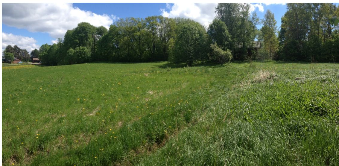
Gumnäs, backen där den medeltida herrgården har funnits. Fotograferat från väster. (AKDG3167:2)