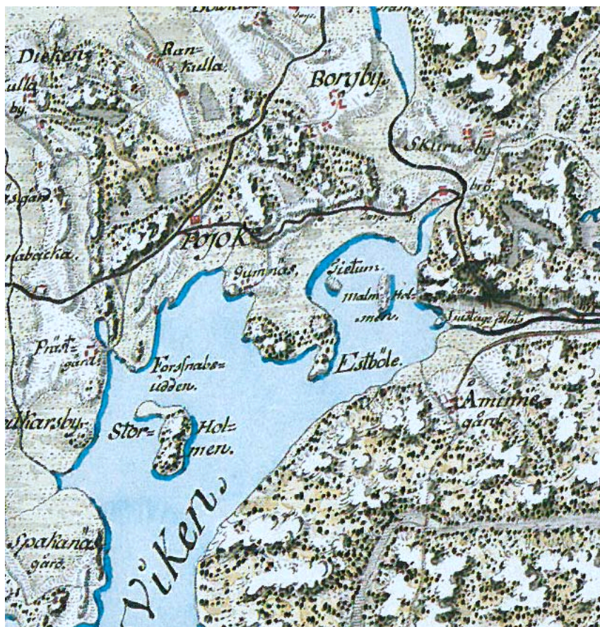
Gumnäs och Pojo kyrkas omgivning i slutet av 1700-talet. Utdrag av Kuninkaan kartasto, ej i skala (Alanen ja Kepsu 1989, s. 31)

Vid planeringen av inventeringen utnyttjades också Lantmäteriverkets material från flyglaserskanningar. Det var till stor nytta vid fjärrkarteringen av fornlämningarna och även för att förstå störningar (t.ex. grusgropar, terrasseringar) som orsakats av senare markanvändning. I delområde 2 avslöjade materialet från flyglaserskanningarna inga nya objekt men inom andra områden hittades med hjälp av materialet bland annat många botten för kolmilor.