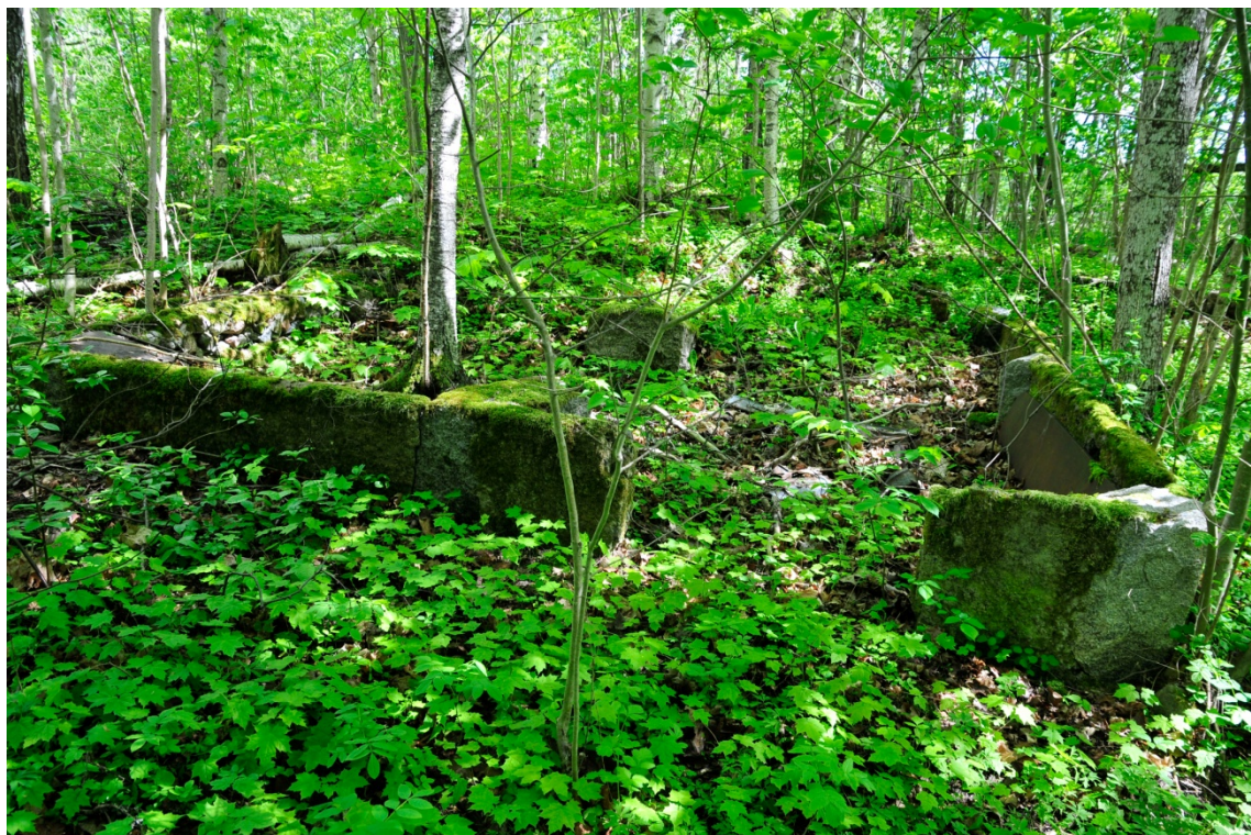
Gumnäs. Byggnadsgrunder i backens östra del. Fotograferat från väster. (AKDG3167:3)