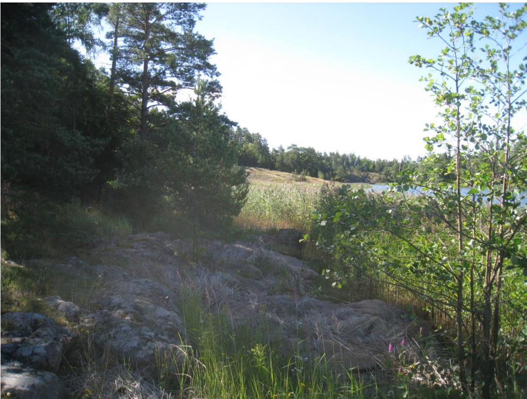
Kuva 22: Kaavan keskiosan länsirantaa.