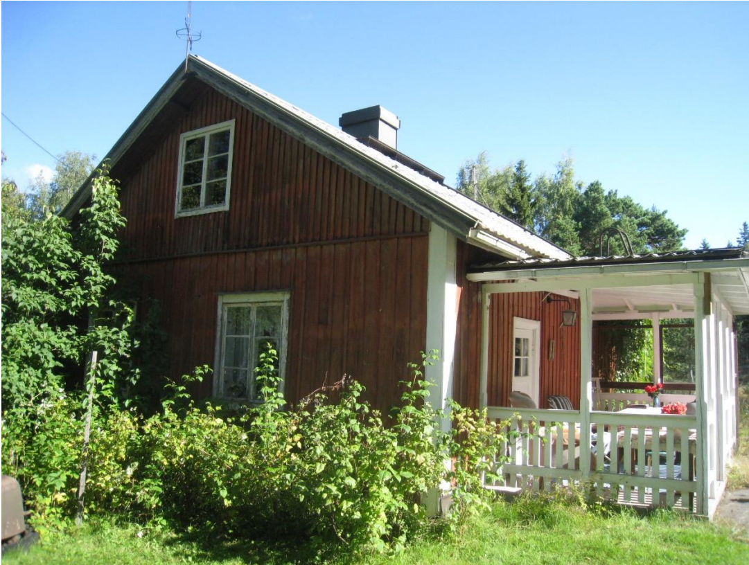
Kuva 3: Vanha punainen mökki. Kuva länsi-lounaissuunnasta.