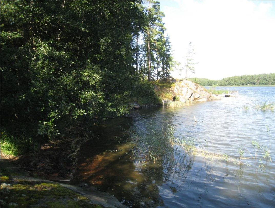
Kuva 21: Niemen pohjoisrantaa.