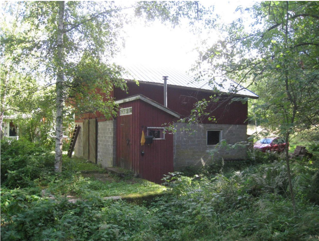
Kuva 18: Vanha talousrakennus tontilla 1. Kuva lännestä.