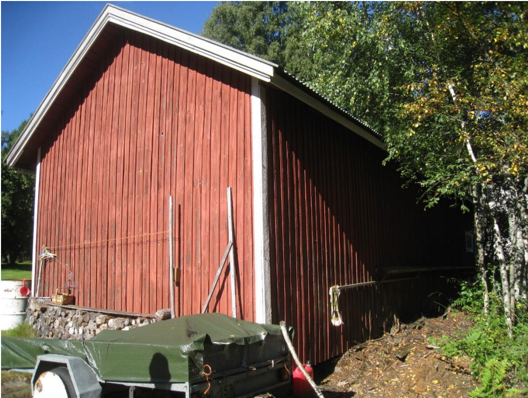
Kuva 6: Vanha piharakennus. Kuva kaakosta.