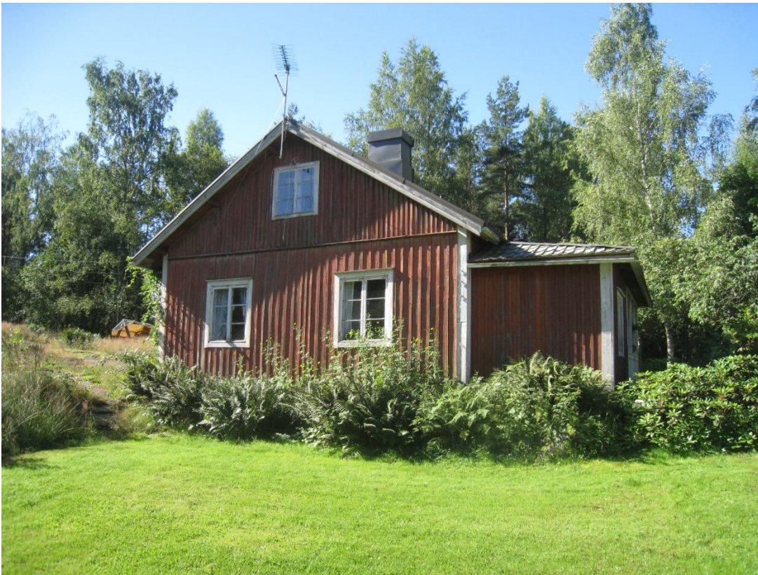
Kuva 4: Vanha punainen mökki. Kuva koillissuunnasta.