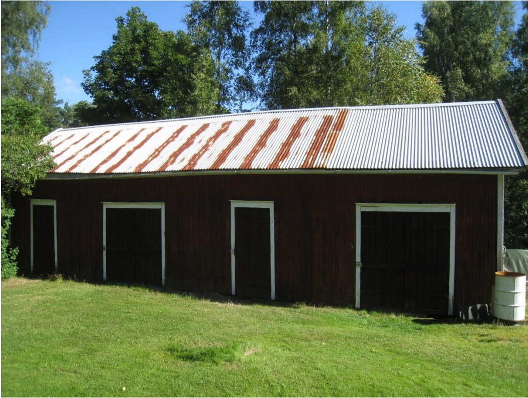
Kuva 5: Vanha piharakennus. Näkyy kuvassa 2.