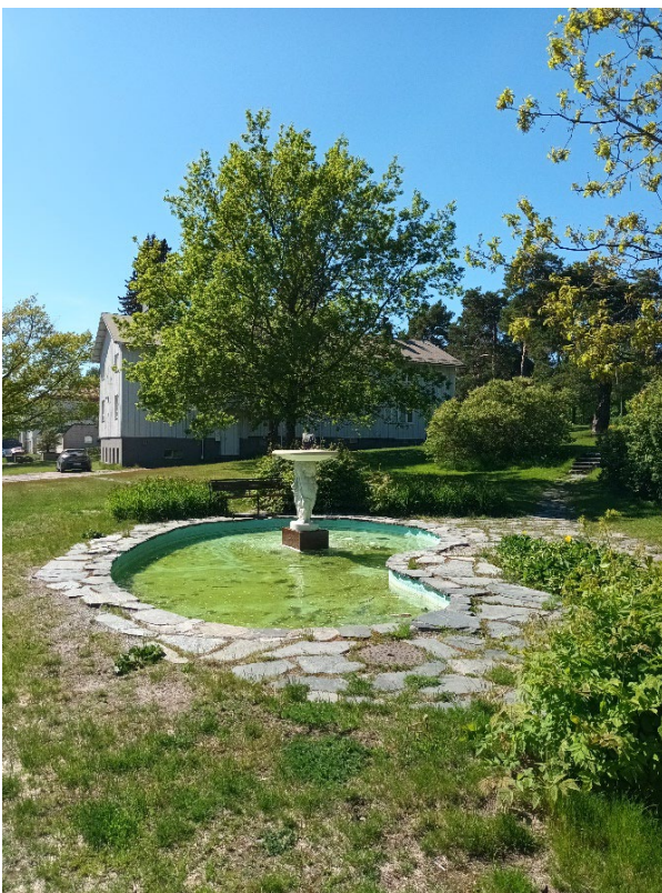
Bild 4. Springbrunnen med marmorstatyn. Kuva 4. Marmorinen suihkulähde.