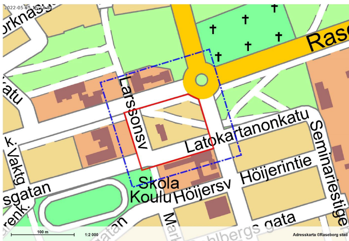
Bild 1. Planområdets läge (röd linje) och närinfluensområde (blå sträckad linje)