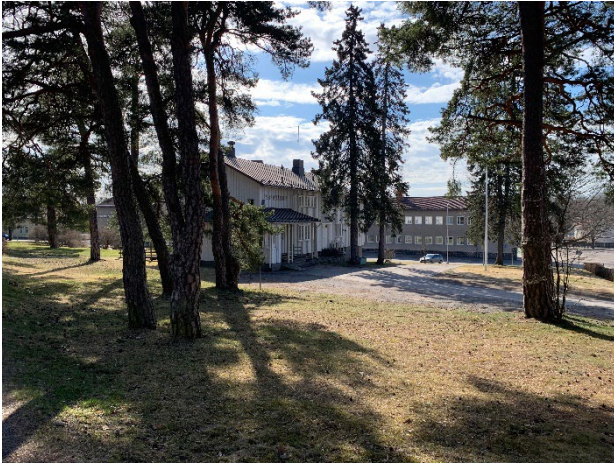
Bild 2. Ystadsgården sett från nordvästra hörnet. Kuva 2. Ystadsgården luoteiskulmasta katsottuna