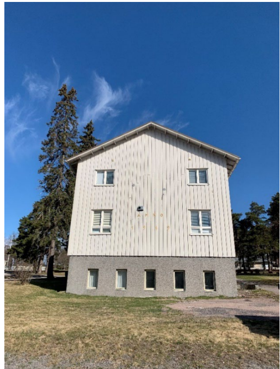
Bild 5. Ystadsgården sett från Ladugårdsgatan. Kuva 5. Ystadsgården Latokartanonkadulta katsottuna