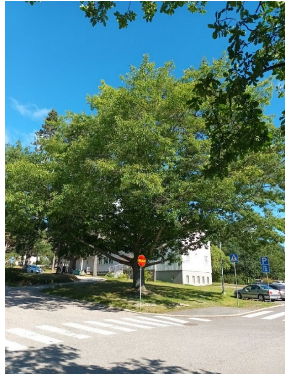
Bild 3. Bevarad Rödek Kuva 3. Säilynyt punatammi