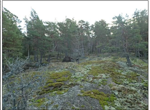
Koillisen erillisosan kalliomaastoa