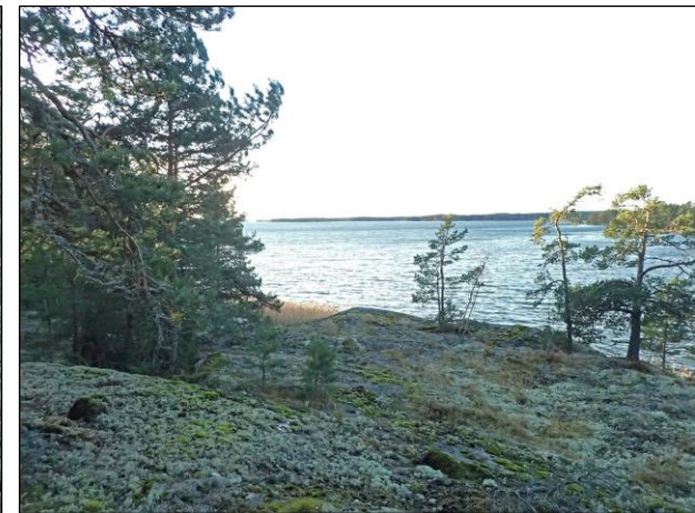
Lounaisosan länsirannan kalliota länteen.