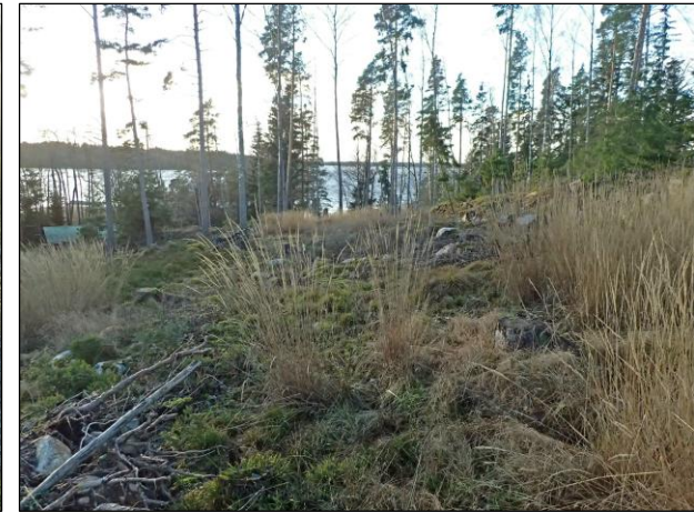
Koillisosan eteläpään maastoa ja lounaisosan mäenrinnettä länteen.