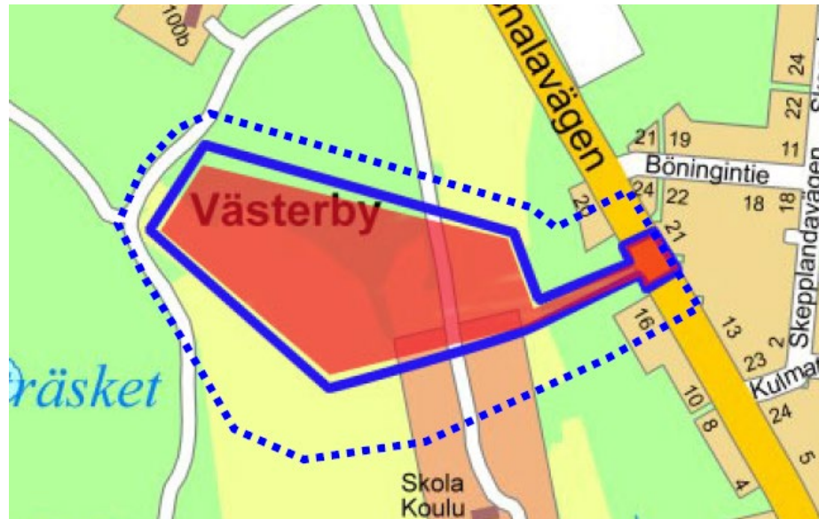
Bild 2. Planområdet och influensområde

Alueen länsipuolella on frisbeegolf-rata.