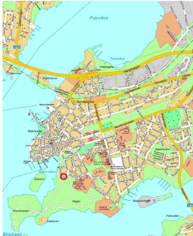
Bild 1. Planområdets läge

Kaikki kiinteistöt sijaitsevat Tammisaaren kaupunginosassa 4, korttelissa 40. Etäisyys Raatihuoneentorille on noin 500 m.