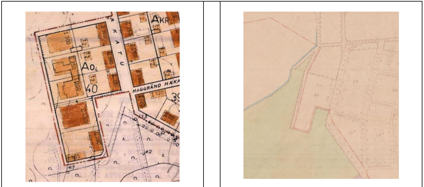
Bild 4. Utdrag från detaljplanen 185-29 (till vänster) och från detaljplanen 37-8 (till höger).