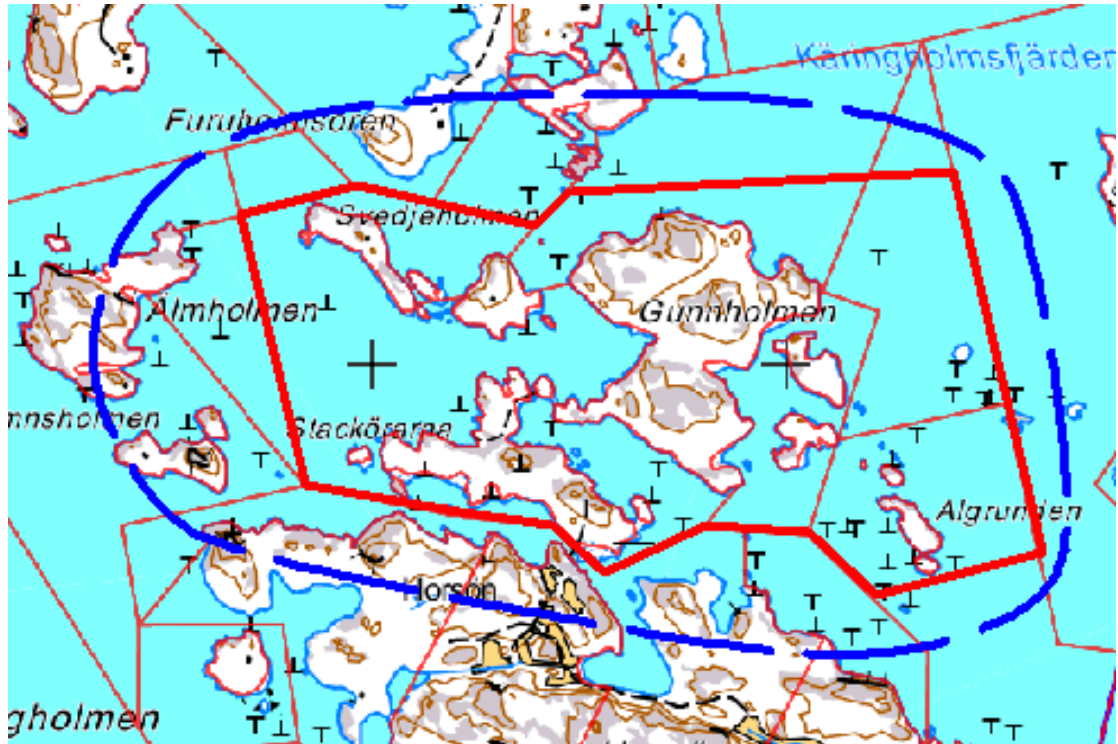
Ranta-asmakaavan alue rajattu punella. Kaavan vaikutusalue on rajattu sineellä.

Alueella ei ole ennestään ranta-asmakaavaa eikä yleiskaavaa. Ympäristöministeriön v. 2006 vahvistetussa maakuntakaavassa ei ole muita ranta-asmakaavaa koskevia merkintöjä kuin että alue kuuluu ulkosaariston vyöhykkeeseen vz2.