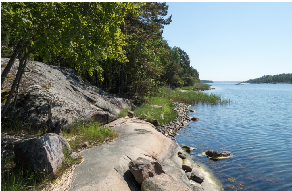
Område 3. Strandområdet.

Område med skogstypen VMT med tall, gran, asp, björk och en som övervägande. Även några grova aspar. Stranden mest morän med inslag av vass. Fåglar som hördes i området: bofink, grönsångare, koltrast, ärtsångare, talgoxe kråka och större hackspett. I viken utanför sågs en ungvall av knipa samt närvarande men inte häckande: fiskmå, fisktärna, gråhäger, trana, strandkata, skrattmå och vigg.