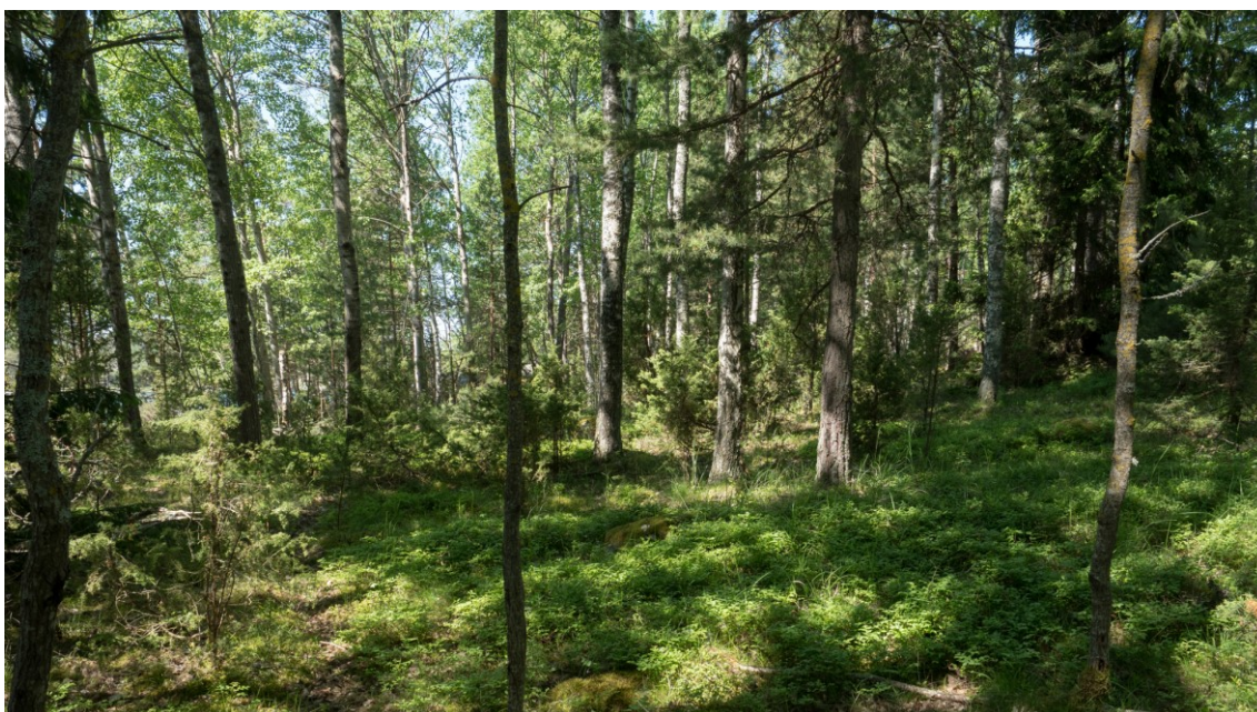
Område 3 inre delarna.