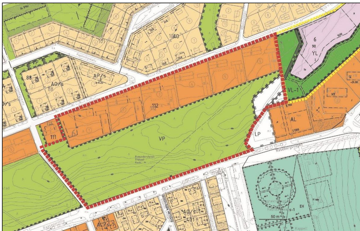
Bild 2: Utdrag ur sammanställningen av detaljplaner. Planområdets gräns visas med rött. Den lagkraftvunna planen Björknäsgatan 41 (arkiv. 1076-73, daterad 8.6.2015) på nordöstra sidan visas med en gul gräns/ Kuva 2: Ote voimassa olevista asemakaavoista. Kaava-alueen suurpiirteinen rajaus on osoitettu punaisella. Keltaisella rajauksella tuorein suoraan suunnittelualueeseen liittyvä kaava-alue.